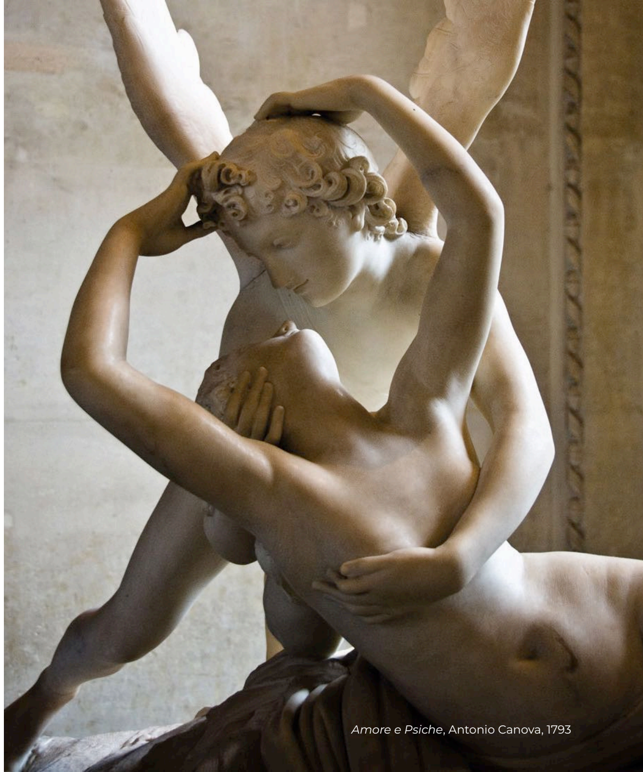
Amore e Psiche, Antonio Canova, 1793

L'obiettivo del confronto voluto da FAMLI è quello di stimolare la dovuta riflessione sulla valutazione collegiale tra il medicolegale e lo specialista di branca, che ove ben armonizzata ed orientata alla funzione medicogiuridica, garantisca la qualità di una prestazione medicolegale ponendola quale strumento di garanzia nel contesto di tutti gli ambiti in cui il riconoscimento di responsabilità e la valutazione del danno alla persona necessita di un momento di sintesi necessario ed irrinunciabile.