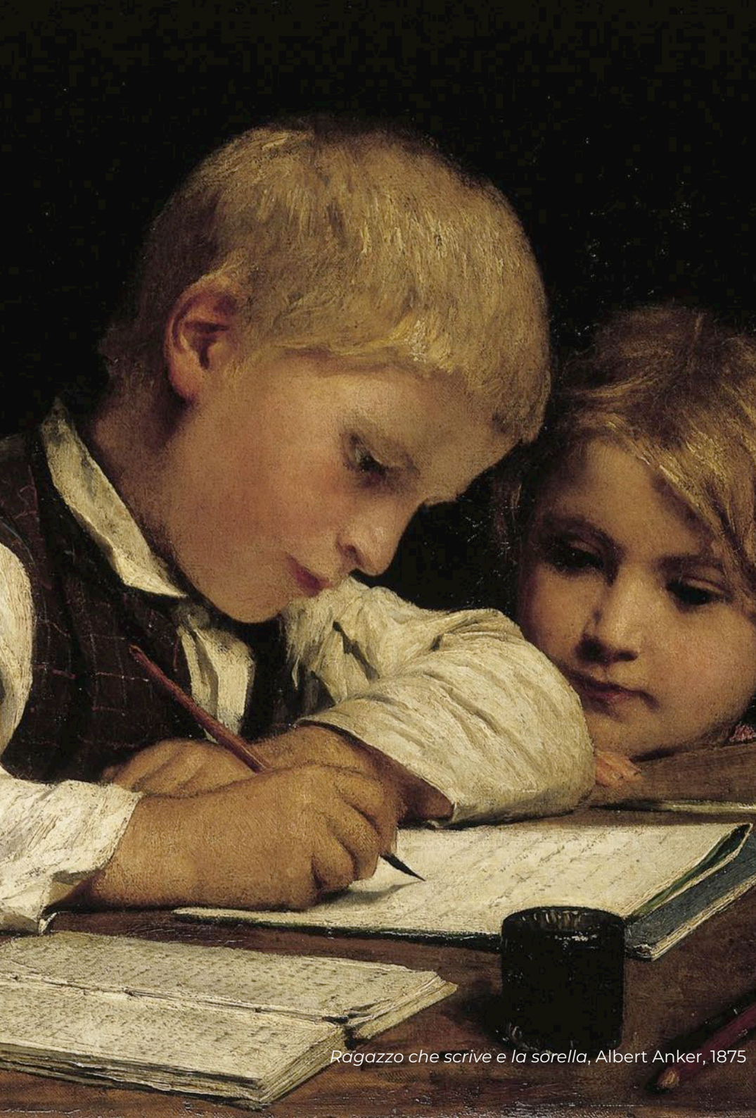
Ragazzo che scrive e la sorella, Albert Anker, 1875